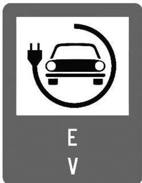
Figura 3. Panou de informare

19.să se asigure că stațiile de reîncărcare trebuie să fie în conformitate cu cerințele standardului pe părți SR EN IEC 61851 (Sistem de încărcare conductivă pentru vehicule electrice);