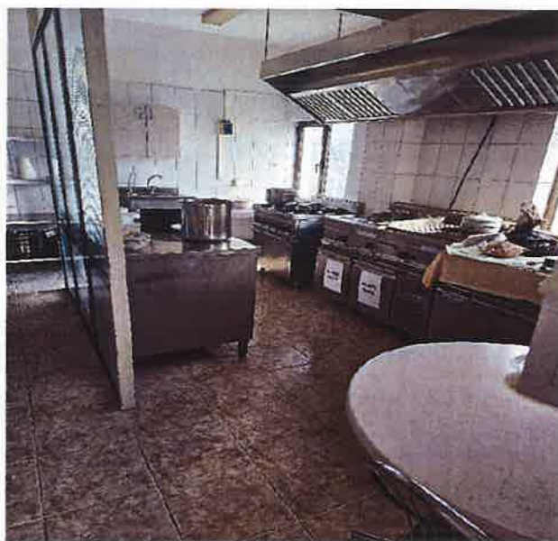
*Sala de mese și bucătăria