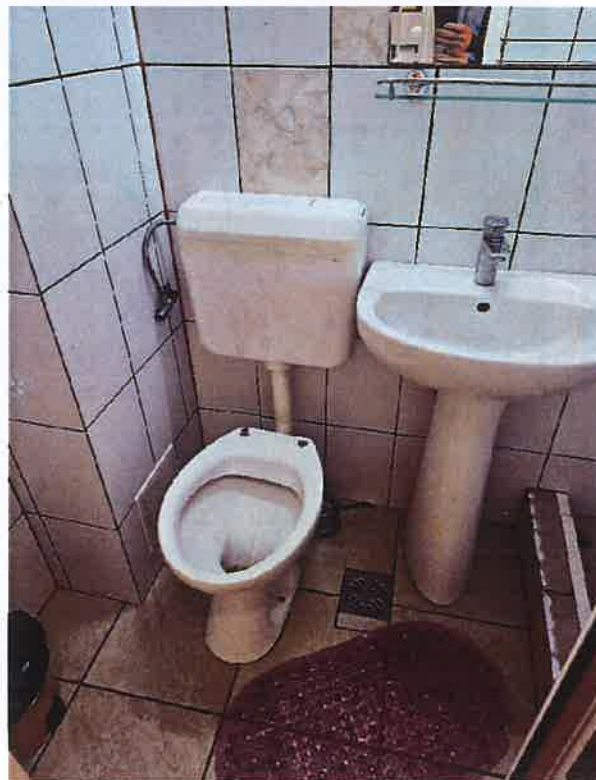
*Cada cu margini înalte + vas wc fără capac , fără bară sprijin și prag înalt la cădița de duș

Domeniul privind prevenirea torturii în locurile de detenție și a altor pedepse ori tratamente crude, inumane sau degradante – MNP