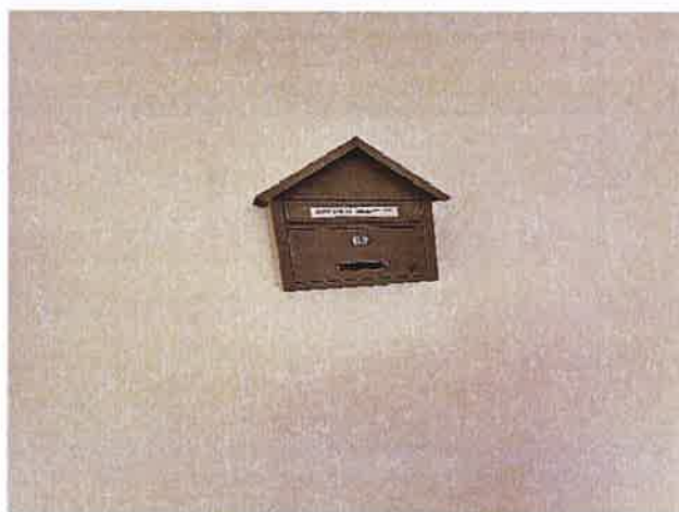
*Cutia de sugestii și reclamații

În privința sugestiilor și reclamațiilor , beneficiarii aveau această posibilitate, de a le formula și adresa, fiindu-le pusă la dispoziție o cutie colectoare . În Registrul de evidență a cazurilor de abuz, neglijare și discriminare , nu existau înregistrări, până la momentul vizitei.