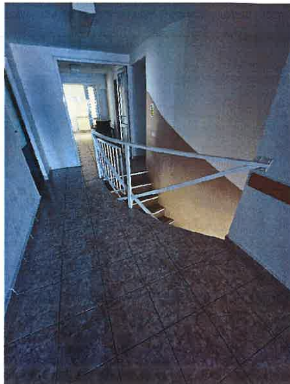
*Holurile, de la parter și etajul clădirii, fără bare de sprijin (mâna curentă)