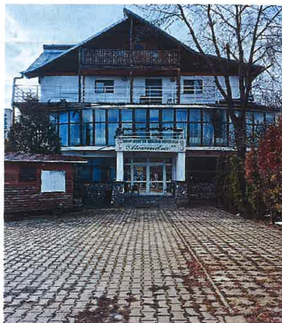
*Intrarea în Centru

Activitățile desfășurate în Centru erau reglementate de acte normative aplicabile în materie, care vizau organizarea și funcționarea serviciilor sociale, dintre care menționăm, cu titlu de exemplu: •Legea nr. 197/2012 privind asigurarea calității în domeniul serviciilor sociale, cu modificările și completările ulterioare; •Normele metodologice de aplicare a prevederilor Legii nr. 197/2012 privind asigurarea calității în domeniul serviciilor sociale, din 01.08.2024 (parte integrantă din H.G. 5 nr. 118/2014 și H.G. nr. 924/2024); •Legea nr. 17/2000 privind asistența socială a persoanelor vârstnice, republicată, cu modificările ulterioare; •H.G. nr. 886/2000 pentru aprobarea Grilei naționale de evaluare a nevoilor persoanelor vârstnice; •Legea nr. 100/2024 pentru modificarea și completarea unor acte normative în domeniul asistenței sociale; •H.G. nr. 1492/2022 pentru aprobarea Strategiei naționale privind îngrijirea de lungă durată și îmbătrânirea activă pentru perioada 2023 – 2030 etc.