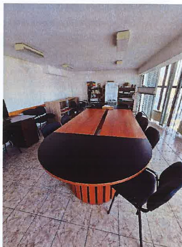
*Sala de activități

Domeniul privind prevenirea torturii în locurile de detenție și a altor pedepse ori tratamente crude, inumane sau degradante – MNP