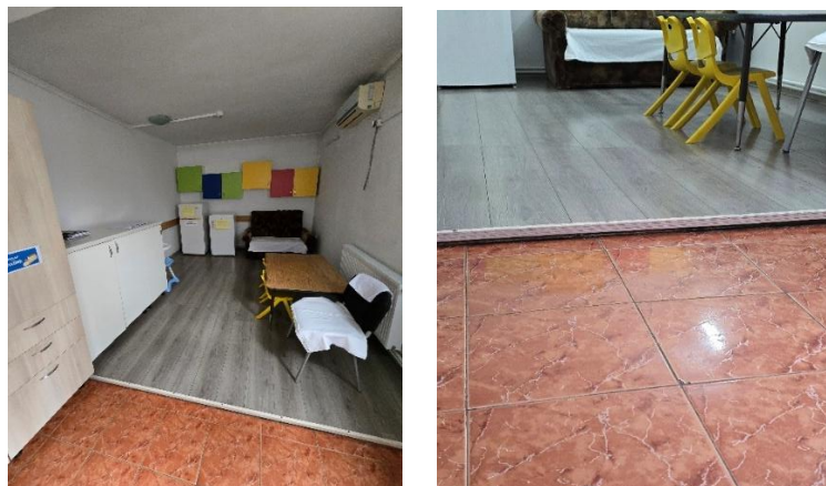
* Diferență de nivel (prag) între gresie și parchet în sala de mese

În sala de mese a fost identificată o diferență de nivel de aproximativ 5-7 cm la îmbinarea dintre gresie și parchet, prag periculos care poate provoca accidente prin împiedicare și cădere, atât în rândul beneficiarilor, cât și al personalului. Echipa de vizită recomandă eliminarea acestui prag astfel încât să se evite riscul de accidentare, potrivit indicatorului S1.2 Im5, Standard 2 – Siguranță și protecție, Modul VI - Mediul fizic de viață din Anexa nr. 1 a Ordinului nr. 25/2019: „Materialele folosite la pardoseli și pereți (vopsea, gresie, parchet, linoleum, covoare, etc.) sunt potrivite scopului fiecărui spațiu și sunt alese astfel încât să evite riscul de îmbolnăvire sau a unor accidente domestice (alunecări, căderi, ș.a.) ”.