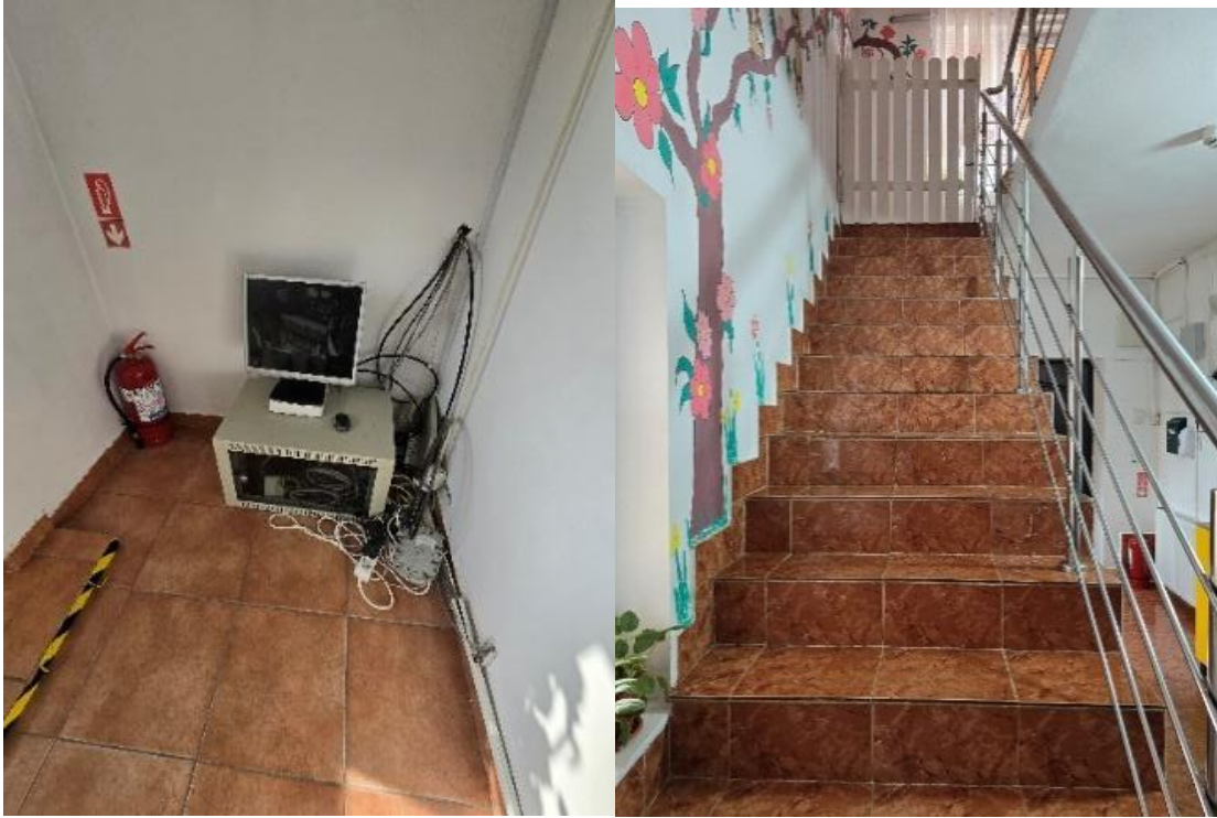
* monitorul și serverul sistemului de supraveghere video, *Scări de acces – balustradă cu înălțime neconformă amplasate direct pe pardoseală

Balustrada de acces către etaj prezintă un risc de securitate pentru copiii cu mobilitate, fiind insuficient de înaltă. Se recomandă instalarea unui sistem de protecție suplimentar sau înălțarea celei existente, porțița cu zăvor montată la capătul scărilor fiind doar o măsură de siguranță parțială.