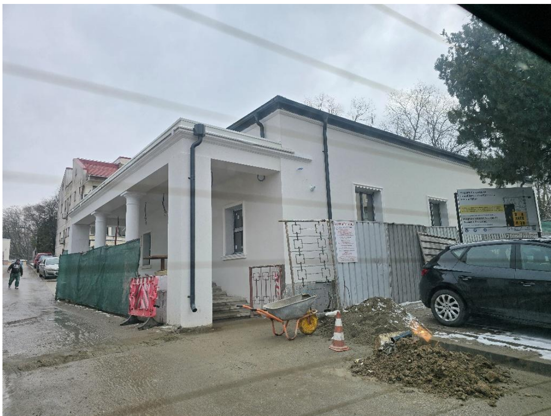
*Casa de Tip Familial "Irina", aflată în curs de renovare/consolidare

Reprezentanții MNP au recomandat ca informațiile de pe site-ul instituției să fie actualizate în timp util, pentru a asigura transparența și informarea corectă a publicului și a autorităților de control.