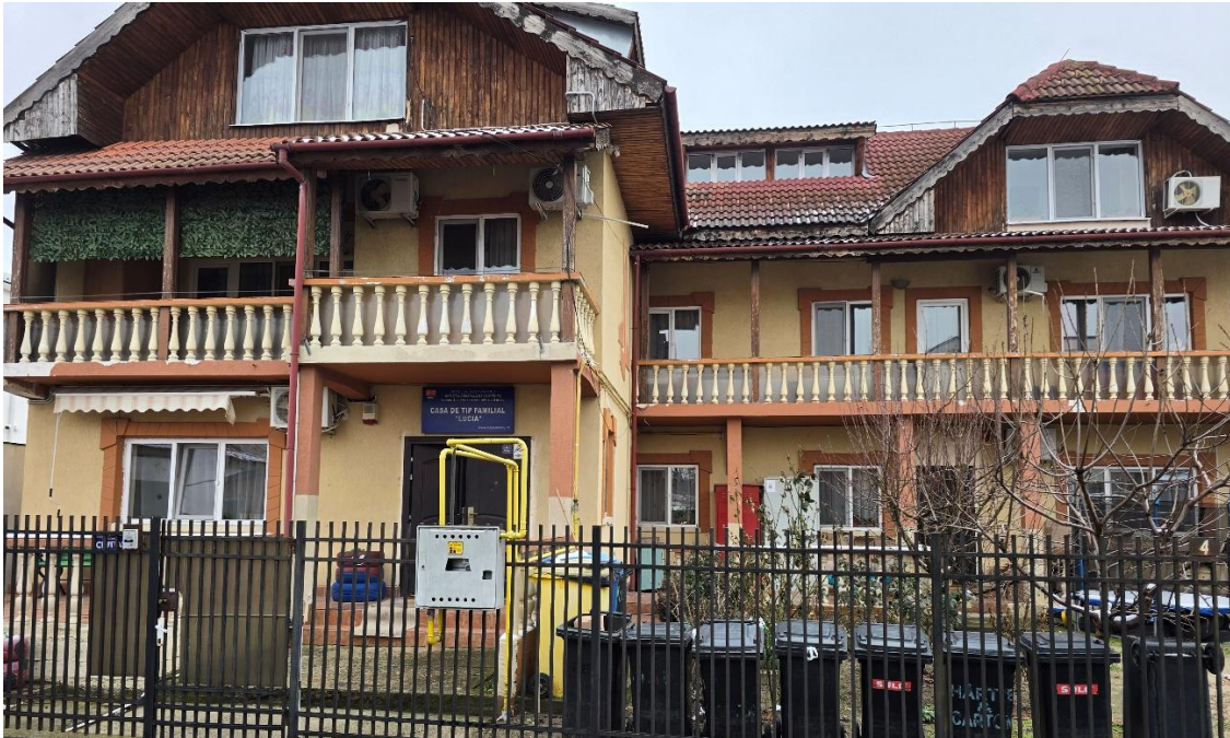
*Casa de tip familial „Lucia”

Imobilul, achiziționat de DGASPC Dolj în anul 2007 și utilizat anterior de Centrul Maternal „Sfânta Ecaterina”, funcționează în prezent cu o capacitate de 12 beneficiari. Unitatea deține Licența de funcționare seria LF nr. 0000686, eliberată de Autoritatea Națională pentru Protecția Drepturilor Copilului și Adopție (ANPDCA) pentru perioada 22 octombrie 2025 – 21 octombrie 2030, precum și Autorizația sanitară nr. 4183/13.11.2020, emisă de Direcția de Sănătate Publică Dolj. Centrul deține autorizația de securitate la incendiu nr. 55293 din 07.10.2010, eliberată de Inspectoratul pentru Situații de Urgență “Oltenia” al Județului Dolj.