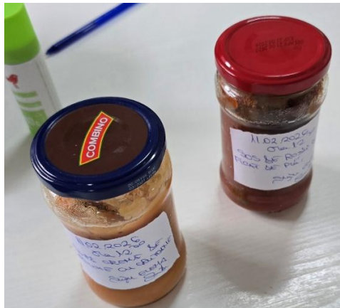
*recipiente cu probe alimentare

Hrana zilnică a beneficiarilor este preparată în bucătăria casei, care este igienizată și dotată corespunzător (aragaz, hotă, chiuvetă, dulapuri, cântar, blender, ustensile). Casa dispune de un spațiu de depozitare a alimentelor în condiții optime și de o sală de mese dotată cu frigidere, dulapuri, masă, scaune și o canapea. Sunt asigurate trei mese principale și gustări, incluzând fructe și legume zilnic. La întocmirea meniului se iau în considerare recomandările medicilor specialiști privind regimurile alimentare.