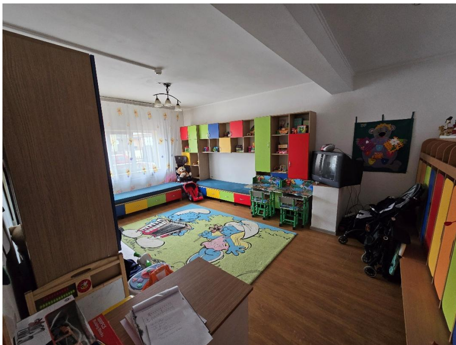
*camera de joacă