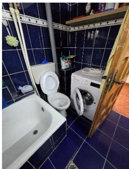
* baia principală: amplasarea vasului de toaletă în spațiul îngust dintre cadă și mașina de spălat

Grupurile sanitare nu erau accesibilizate, pe motiv că toți copiii aveau forme grave de handicap, majoritatea fiind nedeplasabili și utilizând scutece pentru incontinență. La baia principală care deservește cele patru dormitoare, vasul de toaletă este poziționat în spațiul îngust dintre cadă și mașina de spălat.