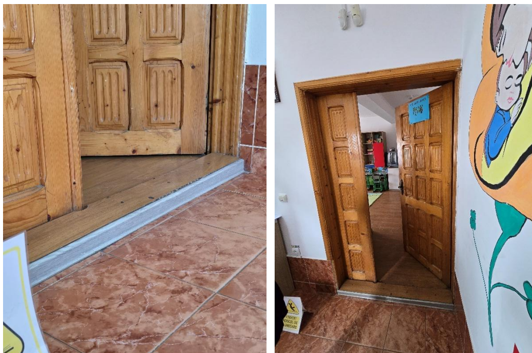
*detaliu prag la intrarea în camera de joacă

O problemă similară a fost identificată și la pragul poziționat la intrarea în camera de joacă.